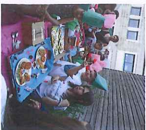
L'atelier du Chef

Les enfants pourront participer, au même coût que la garderie, à des activités éducatives, en dehors du temps scolaire. Elles ont pour but de permettre aux enfants de découvrir de nouvelles activités et de favoriser leur épanouissement.