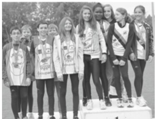
La délégation... les garçons