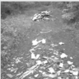
Dépôt d'amiante sur la boucle 16 entre Vignoc et Guipel

Plusieurs tas de déchets (amiante, parpaings, bois, papier) ont été signalés ces derniers mois dans les chemins de randonnée du Val d'Ille. Nous attirons l'attention sur le fait que l'enlèvement de ces déchets engendre des frais conséquents pour la collectivité. C'est également un manque de respect pour le travail d'entretien effectué par le chantier d'insertion du Val d'Ille et pour les autres usagers des chemins de randonnée.