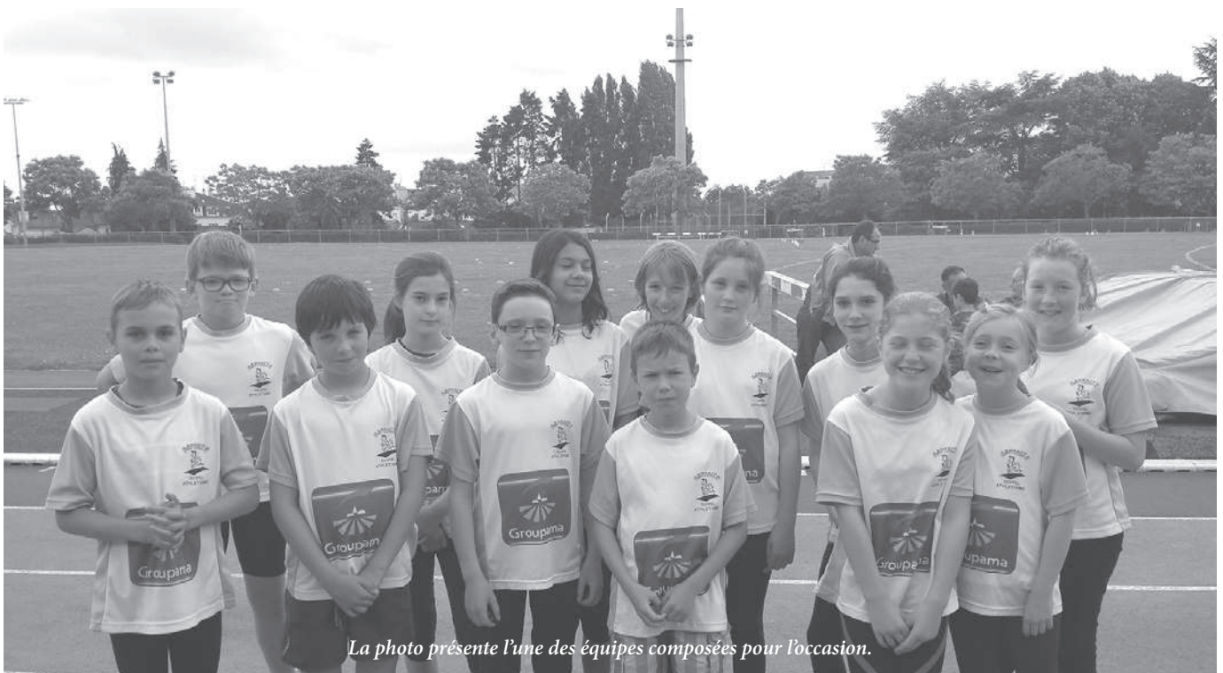
La photo présente l'une des équipes composées pour l'occasion.

Contact : asphalteguipel@gmail.com et Site Internet : https://sites.google.com/site/asphalteguipel/home