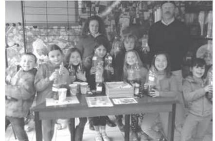
Animation à St-Médard dans le cadre de la semaine pour les alternatives aux pesticides.

Mais la meilleure façon de limiter l'effet de ces produits sur la santé, la qualité de l'eau et l'environnement