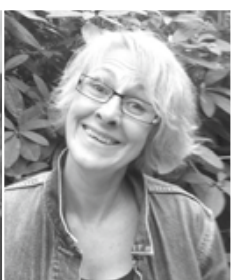
Nathalie Lelièvre Cantine - Garderie Étude