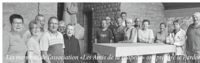
Les membres de l'association «Les Amis de la chapelle» ont préparé le Pardon