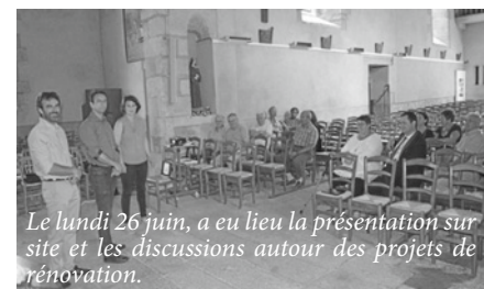
Le lundi 26 juin, a eu lieu la présentation sur site et les discussions autour des projets de rénovation.

Une première intervention citoyenne s'est penchée sur la rénovation de l'édifice : une quinzaine de personnes s'est affairée autour du mur lors