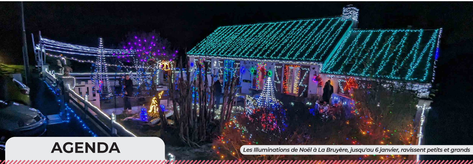
Les Illuminations de Noël à La Bruyère, jusqu'au 6 janvier, ravissent petits et grands