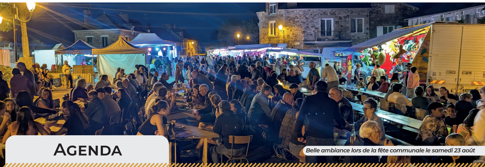
Belle ambiance lors de la fête communale le samedi 23 août