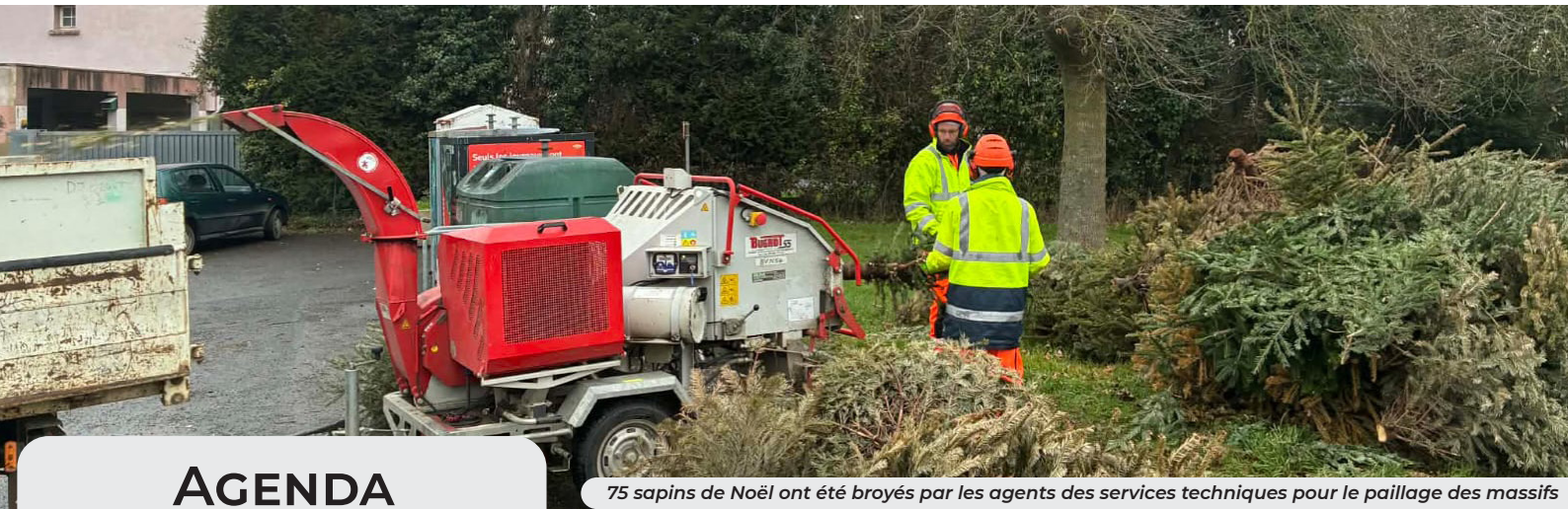
75 sapins de Noël ont été broyés par les agents des services techniques pour le paillage des massifs