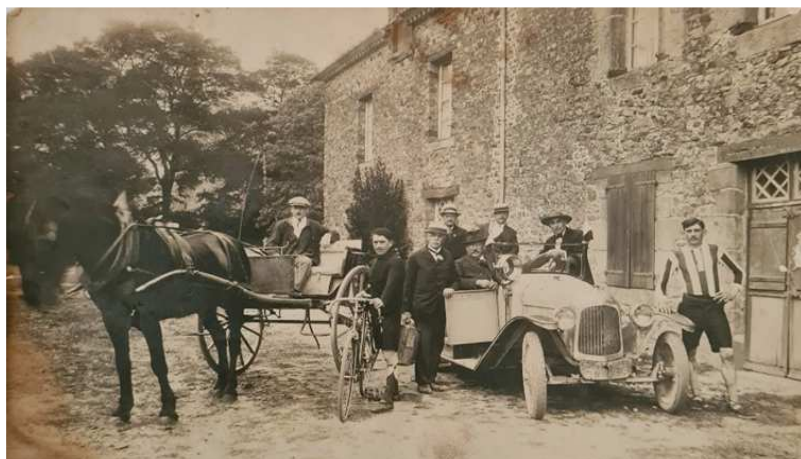
Cette photo a été prise dans le bourg de notre commune, on peut apercevoir le clocher dans les feuillages.

Les courses de Saint-Aubin d'Aubigné à Saint-Médard-Sur Ille se déroulaient entre la voiture à cheval légère de type «anglaise», un cycle de course, une voiture automobile « Torpédo » Citroën et un coureur à pied.