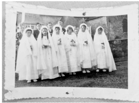
1956 - Groupe de communicants, les filles sont en « toilettes ».

Les jeunes communicantes portaient de longues robes blanches (symbole de leur pureté) avec des jupons, et étaient coiffées d'un bonnet blanc pourvu d'un long voile. Cette tenue était appelée « toilette », elles pouvaient aussi porter une tenue beaucoup plus simple, sans jupon, appelée « Aube ». Les garçons portaient un costume, un brassard blanc ornait leur bras.