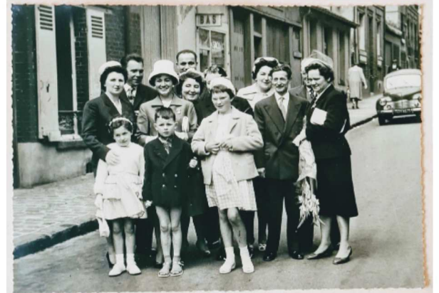
1960 - Famille médardaise invitée à une communion en ville

Catéchisme, présence à l'église et prières pour le côté religieux, shopping, invitations, élaboration du repas de communion pour les parents de la/du communiant(e). Les invités « se mettaient sur leur 31 », les Dames en tailleurs et chapeaux, les messieurs en costumes/cravates et chemises claires.